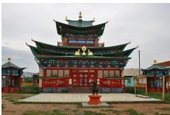
ブリヤートのラマ教寺院

ウラン・ウデはシベリア鉄道と中国まで伸びるモンゴル縦貫鉄道の分岐地としても重要な場所です。