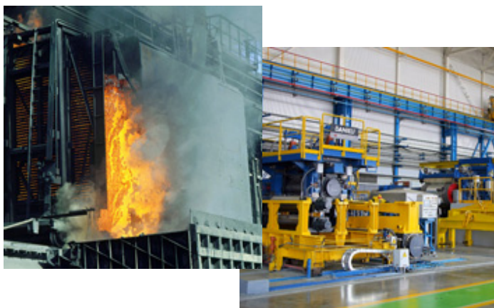
マグニトゴルスク冶金コンビナート

主要企業: マグニトゴルスク冶金コンビナート(MMK)、チェリヤビンスクパイプ圧延工場、ウラル自動車工場、チェリヤビンスク・トラクター工場等、多数。